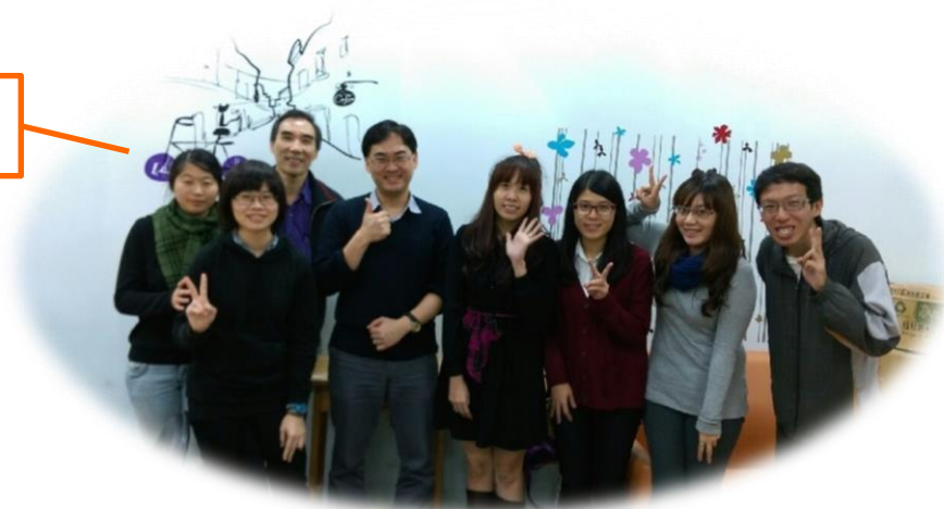
討論結束後的大合照