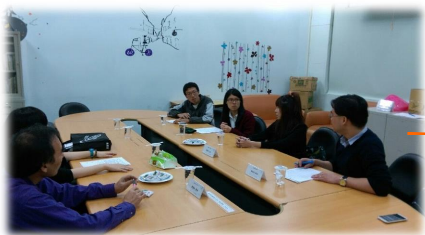
課後討論情形：老師與夥伴 不吝嗇地給予回饋及意見

整體而言，有些技巧與細節是自己從未發現的，像是站在台上會擋住投影片、練習時需要開燈等，有時候需要站在學生的角度，才會知道老師的哪些行為會對學習造成負面影響；與學生的互動也要更多，多問問題，讓他們試著回答，學生回答之後再進行講解，印象將更加深刻，也讓學生養成上課需要隨時注意、回答問題的習慣；第二外語是興趣選修，且沒有進度壓力，上課的方式應更活潑、生動、實用，引起學生的興趣與學習動機，除了有適當的教材內容、教具之外，還要有靈活、適當的運用技巧，才可讓學生開心的學習。