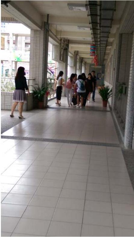
突發事件—情緒障礙的學生被 老師們抬著回輔導室