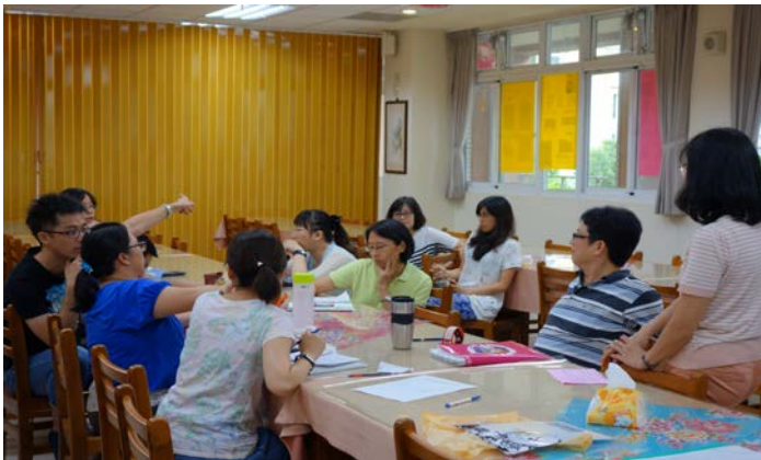
參與自然科領域會議