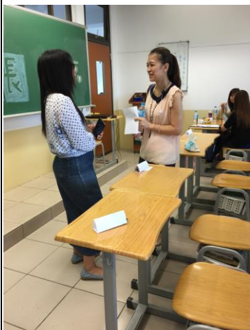
(珮珊老師和家長個別談話)

這週最大的活動是 10/4 學校日，高一的班級為早上到校，133 共來了 18 組的家長。珮珊老師先以 PPT 介紹班級相關規定和希望家長配合的事項以及科的課程介紹。並且建立班級家長的 Line 群組，方便連絡。開放家長提問時，家長的問題大多是關於回家作業、放學留校考試時間、回家時間固定、午餐的方式等。