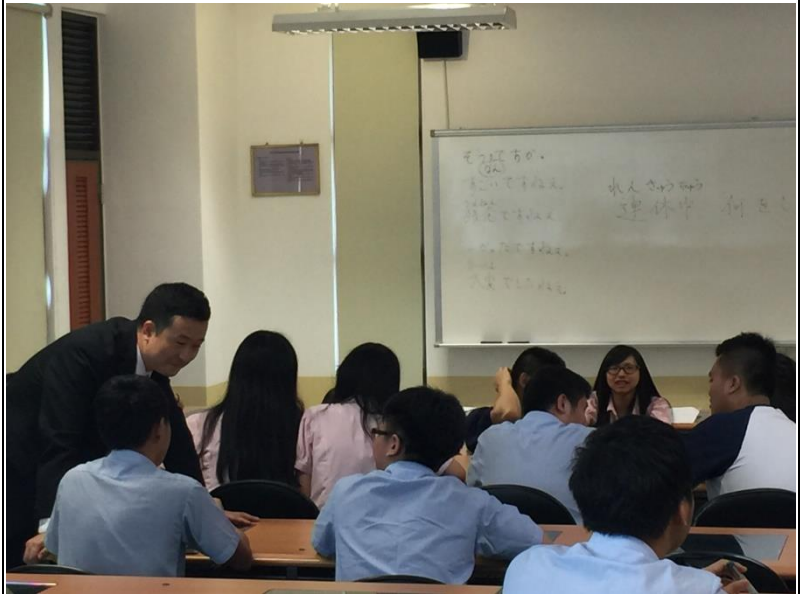
(講師至各組聆聽指導學生對話內容)

飯店實務課程對於應日科的學生來說相當的有助益，因為多數同學如果沒有繼續升學，畢業就會就業，而飯店業則是同學喜歡去的工作之一。下課時間，有學生向講師詢問要和日本客人聊天的內容，就如講師所言，和客人聊天的內容包羅萬象，因此平時就要多涉獵各方資訊。而在和不同的專業背景的客人聊天中，也能學習到許多他行的知識。