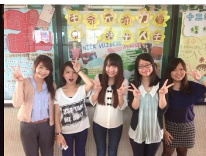
↑ 海報完成了!!! 大家都很开心