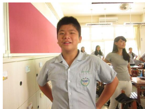
↑ 班上的兩位開心果(分別是班長和副班長)