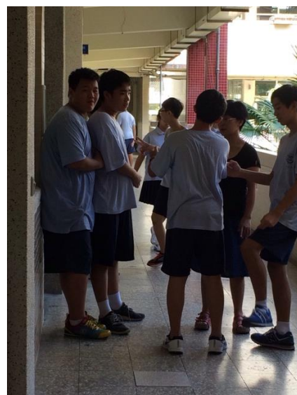
↑和老師相處融洽的學生