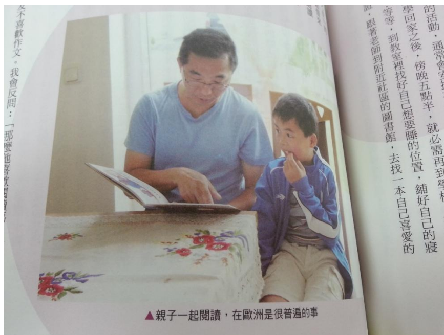
▲親子一起閱讀，在歐洲是很普遍的事

用途只是檢視孩子的學習狀況罷了；反觀台灣，為什麼台灣的補習班會蓬勃發展，甚至補習的年齡層越來越低，有人從學齡前就開始補習了，因為台灣的家長無法接受自己的孩子輸在起跑點，他們寧願自己的孩子課業上一名驚人，而生活技能不會也無差，這就是最大的差別，我會有很深的感觸正是因為我也是在這樣的觀念下成長的，生活方面的事一律都是由我父母親打理，在他們看