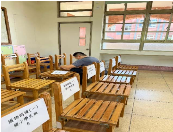
班會話劇比賽題目及腳本