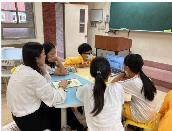
改變教學策略後，透過簡報遊戲和學生互動教學。