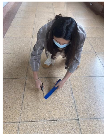
此圖正在為舊大樓破所的地磚做標記。