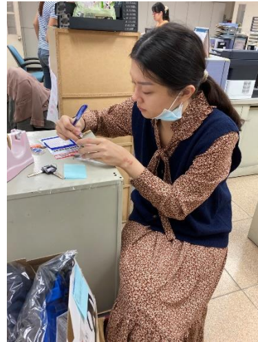
上圖在為鑰匙貼標籤、對應標籤號碼。