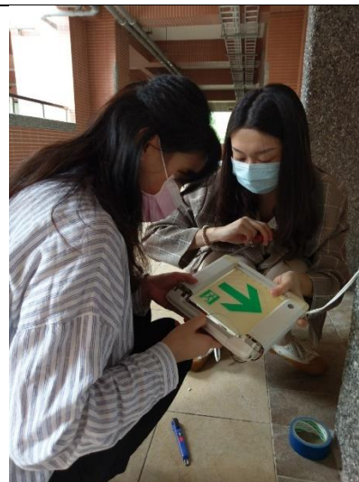
修理綜合大樓掉落的逃生指示牌。