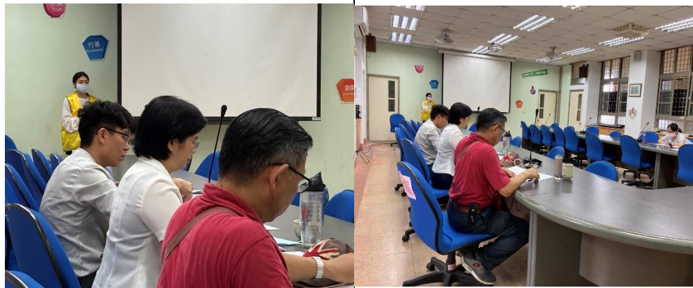
協助拍攝採購工作及審查小組會議。