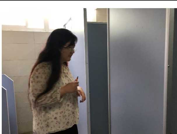
行政實習：檢核校園內廁所打掃情形