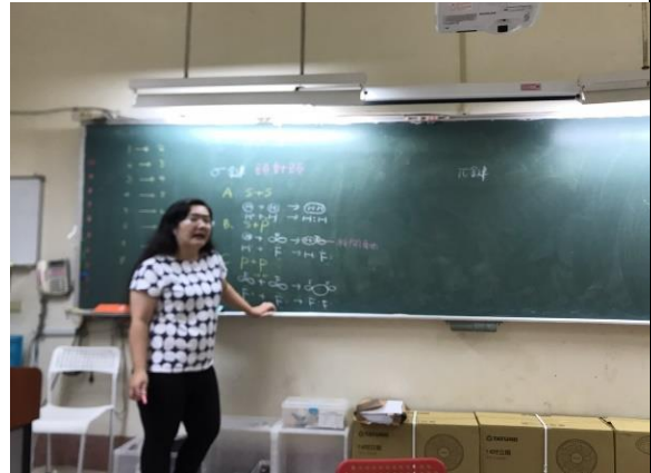
教學實習：下班後與實習夥伴間的試教