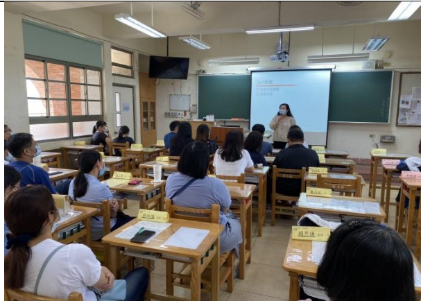
導師實習：家長日與家長們的座談與了解