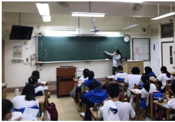
教學實習：高一地球科學代課之授課情形