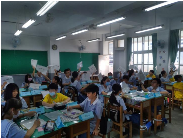
照片三 708 數字遊戲