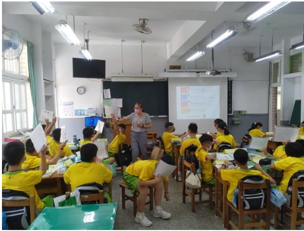
照片一 705 分組座位