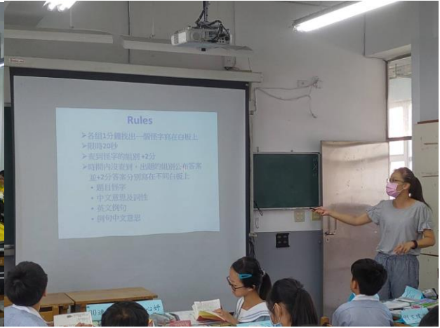
照片二 708 ppt 授課