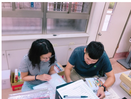
圖一、與雅卉老師討論教材內容

在與師父討論的課程中，發現自己對於教材的內容還可以再更熟悉，備課時，除了要對教材百分百熟悉之外， 更要思考如何呈現給學生知悉、引發學生思考 ，這些都是需要扎穩的基本功。