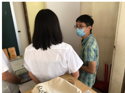
圖三、導師向幹部實際說明工作內容