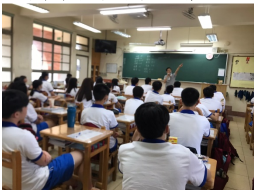
圖二、導師向全班說明課堂規定