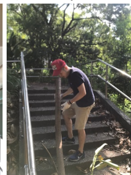
圖四、清淤工程 圖五、清理地下室 圖六、清洗冷氣濾網 圖七、搬運樹木